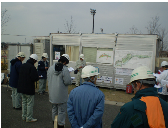
工事概要説明状況