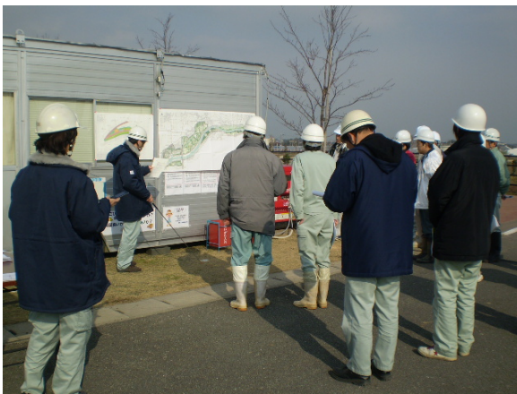
事業概要説明状況